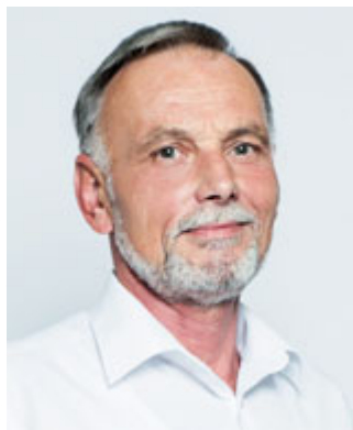
Vážený občane Břeclavi,

dovolte mi, abych Vás pozval na trávení příjemného letního času v našem městě. Léto v Břeclavi si můžete zpestřit mnoha způsoby. Kromě oblíbeného koupaliště, které v nejbližších letech kompletně zrekonstruujeme, můžete vyrazit třeba na nedělní podvečerní koncerty do parku, střední večery v podzámčí patří tradičně hudbě U Kapra.