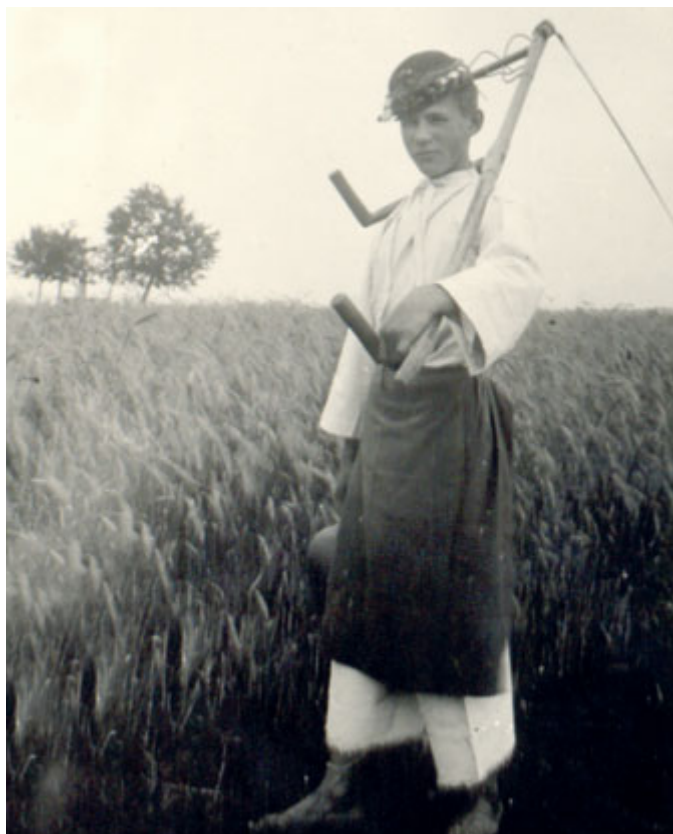
Svatá Markyta vede žence do žita.

Od jara do podzimu se denní režim na zemědělských usedlostech přizpůsoboval práci na poli a v hospodářství. Začínalo se již brzy, první vstávala hospodyně, zatopila, připravila snídaní a obstarala dobytek. Hospodář se staral o koně a přípravu zemědělského nářadí. Na pole se vyjíždělo v brzkých hodinách, v období senoseče se vstávalo kolem 3. hodiny ranní. V devět už pracanti dostali ke svačině kousek chleba a na dvanáctou se chodilo na oběd nebo jej přinášely děti v tzv. srostlicích (nádobách sloužících jako jídlonosič). Poté se pokračovalo v práci až do odpolední svačiny kolem třetí hodiny. Domů se odcházelo až v podvečerních hodinách, ve žních často až za tmy.